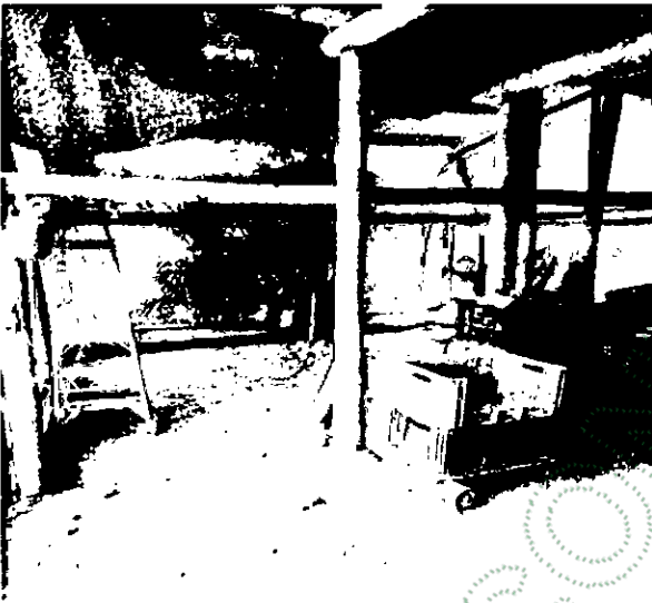
Imagen 3 Imagen 4.