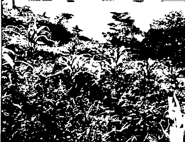
Imagen 1 y 2. Área revegetalizada naturalmente