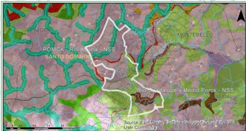
Imagen 5. Zonificación Ambiental – Geo-portal.

En groso modo analizando las determinantes ambientales de esta área de interés, abarcando el predio del señor FREDY HUMBERTO ORREGO MONSALVE C.C 1.044.100.303, se determina que: