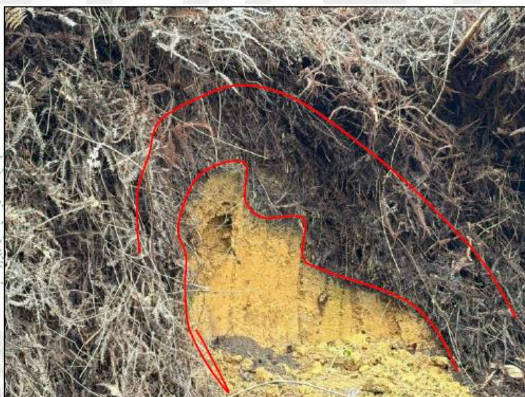
Imagen 5 – Capa Orgánica del suelo – Presuntamente quemado.

Durante la inspección se observaron copos de material vegetal (biomasa) en diferentes puntos del terreno, evidenciando una actividad de rocería cuyo residuo ha sido aprovechado como abono orgánico dentro del proceso de cultivo actualmente en ejecución, ya que el suelo se encuentra estabilizada y con una actividad microbiana alta.