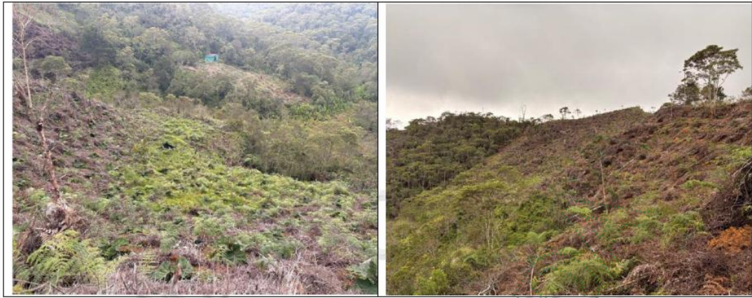
Imagen 1 – Predio sin propietario actual.