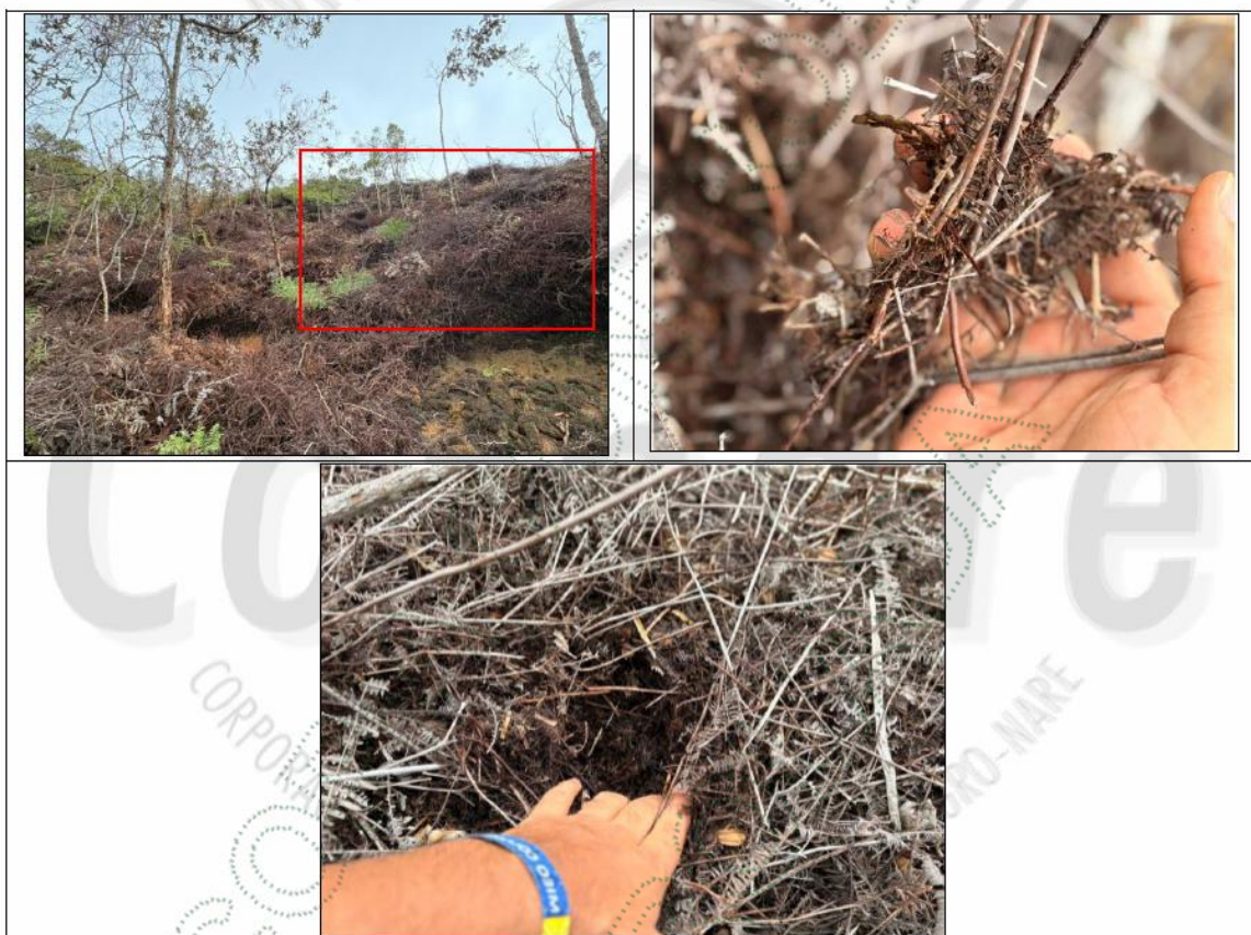
Imagen 4. Material vegetal descompuesto. – No quema.

Teniendo en cuenta la Tabla 1 – Etapas de descomposición del material vegetal, se descarta la presencia de actividad de quema atribuible al señor Fredy Orrego Humberto Monsalve, identificado con cédula de ciudadanía N.º 1.044.100.303.