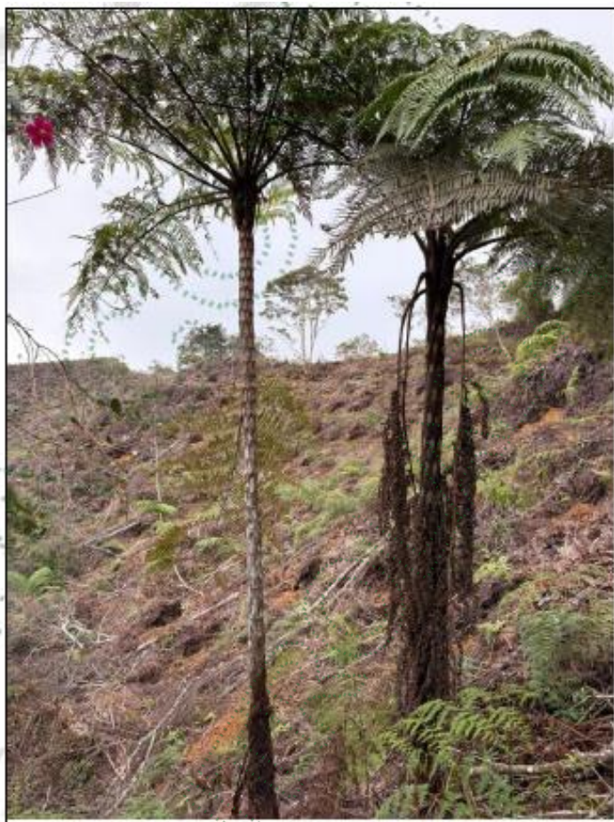
Imagen 6 – Cyathea Sp.

Se evidencia una capa gruesa aproximadamente de 30 Cm de material orgánico - sin característica de quema.