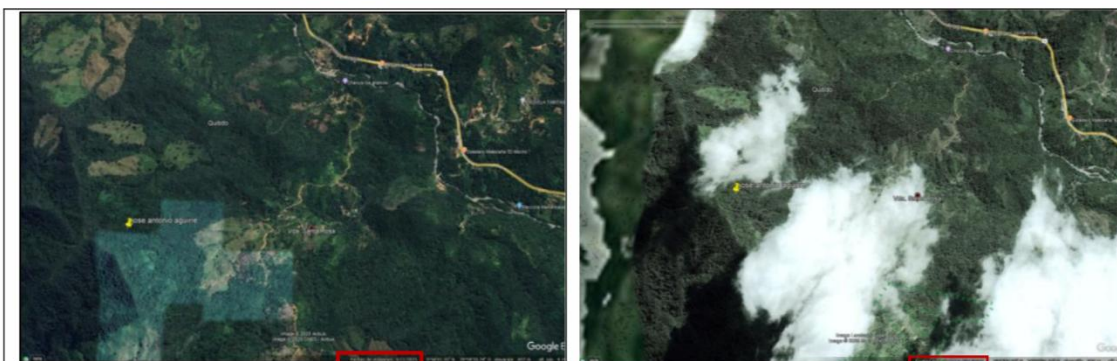
Figura 2. Imagen satelital del año 2012 (izquierda), imagen satelital del año 2025 (derecha), del predio La Esperanza.

Se consultaron, también, las imágenes satelitales correspondiente al año 2012 (Google Earth Pro, imágenes Landsat), las cuales son del año 2012, 13 años posterior al cese de las actividades de extracción de madera mediante autorización, se observó una cobertura vegetal predominantemente boscosa continua, con presencia de bosque natural maduro y parches secundarios en proceso de regeneración. La cobertura densa sugiere un dosel cerrado con bajo nivel de fragmentación, indicando una alta integridad ecológica y mínima intervención antrópica.