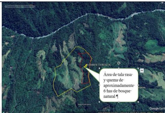
Imagen 8. Imagen satelital de las condiciones ambientales del predio año 2025.