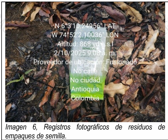
Imagen 6, Registros fotográficos de residuos de empaques de semilla.