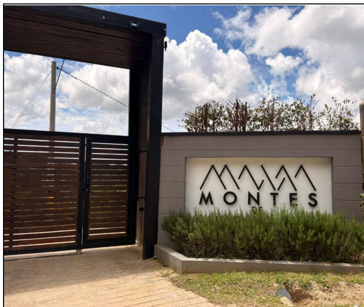
Imagen 1 . Parcelación Montes de Santo Domingo.