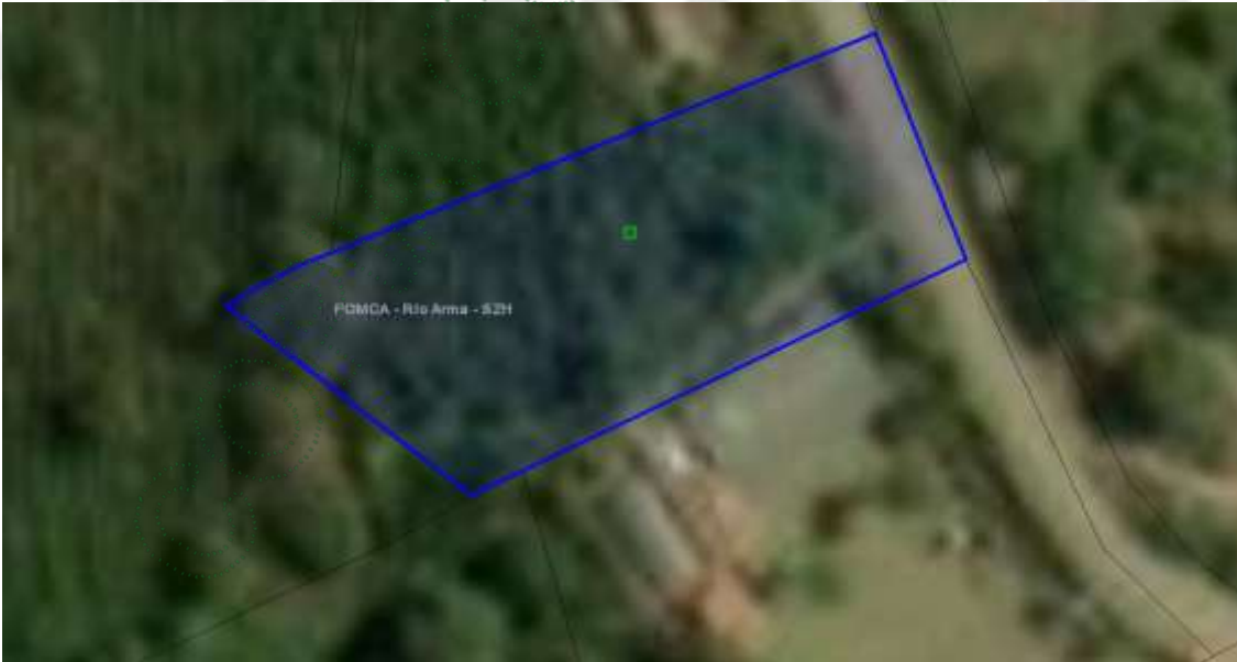
Imagen 1: Ubicación del predio.

Se llevó a cabo visita al sitio de la presunta afectación ambiental el día 03 de octubre de 2025 con el fin de dar atención a la queja, en el predio con FMI 028-21941 ubicado en la vereda Hidalgo del municipio de Sonsón (Ant.) En la visita participó el señor Javier Monsalve Pimienta, técnico de la Regional Páramo Cornare.