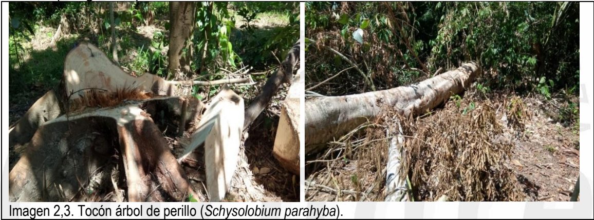
Imagen 2,3. Tocón árbol de perillo ( Schysolobium parahyba ).