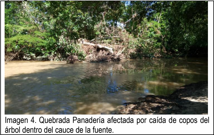
Imagen 4. Quebrada Panadería afectada por caída de copos del árbol dentro del cauce de la fuente.