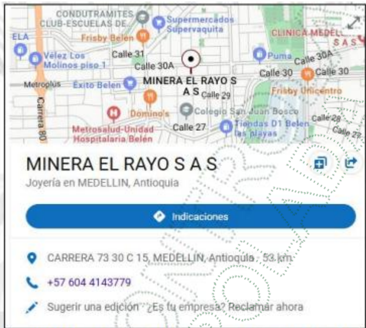
Imagen 3. Localización de la empresa “Minera el Rayo S.A.S”

- Al no tener contacto con la representante legal ni la ubicación en campo de la empresa , Minera el Rayo S.A.S, con fin de dar el primer control y seguimiento a la concesión de agua, se investigó en internet, aunque no tiene un sitio Web oficial, se evidencia tienda física en la ciudad de Medellín Antioquia catalogada como “Joyería” , El número telefónico no está en línea.