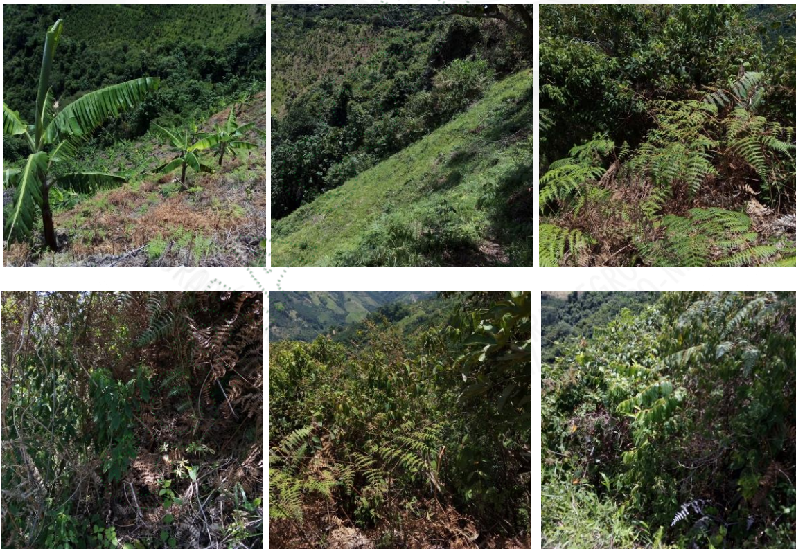
Sitio de las actividades.