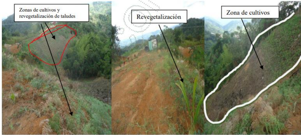
Imagen 5, 6 y 7. Revegetación natural del predio y zonas de cultivos