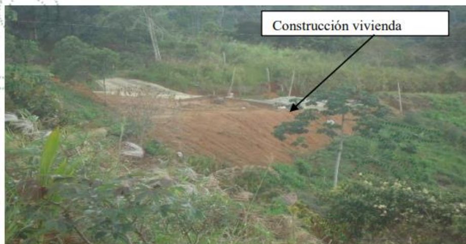
Imagen 2. Sitio de construcción de la vivienda

El lote se encuentra contiguo a la vía, en él se realizó un banqueo, para construcción de vivienda, se evidencia que en dicho lote se cuenta con áreas de cultivos, siembra de yuca.