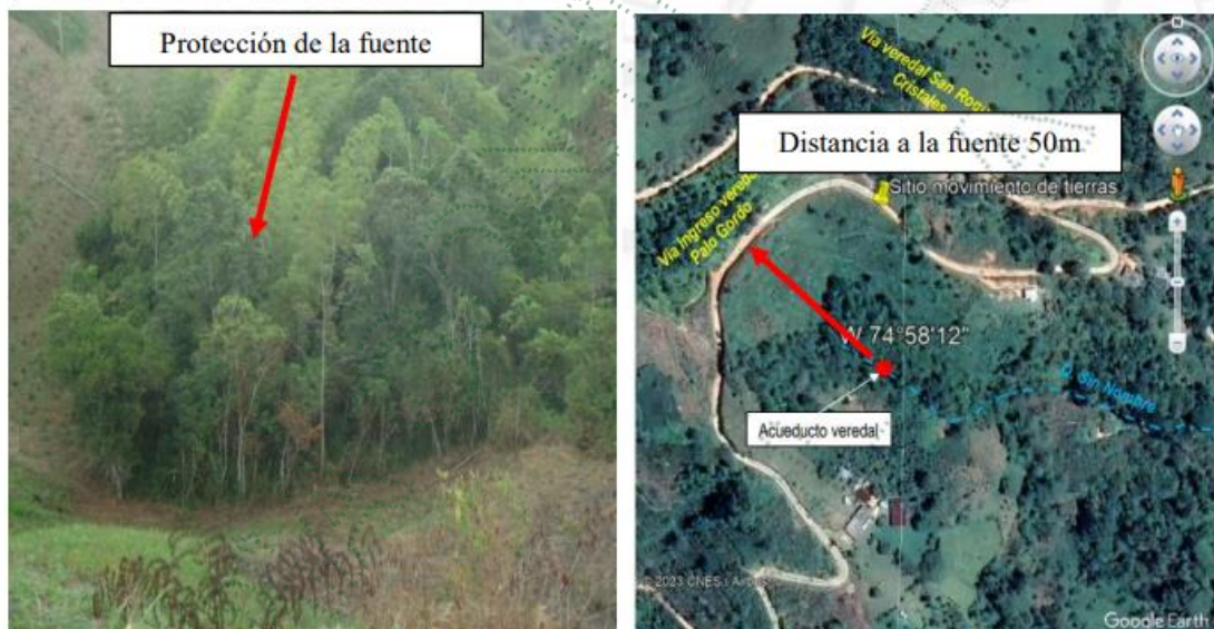
Imagen 3 y 4. Estado de protección y distancia del banqueo a la fuente

En la parte inferior de dicho lote y a una distancia aproximada de 50m se encuentra un nacimiento, según la información reportada en la queja, este nacimiento abastece los usuarios del acueducto Frailes, sin embargo no se presenta afectación a la misma, la zona donde se ubica el nacimiento se encuentra protegida con guaduales y bosque nativo propio de la zona