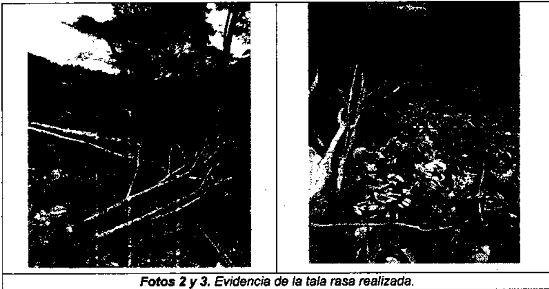
Fotos 2 y 3. Evidencia de la tala rasa realizada.