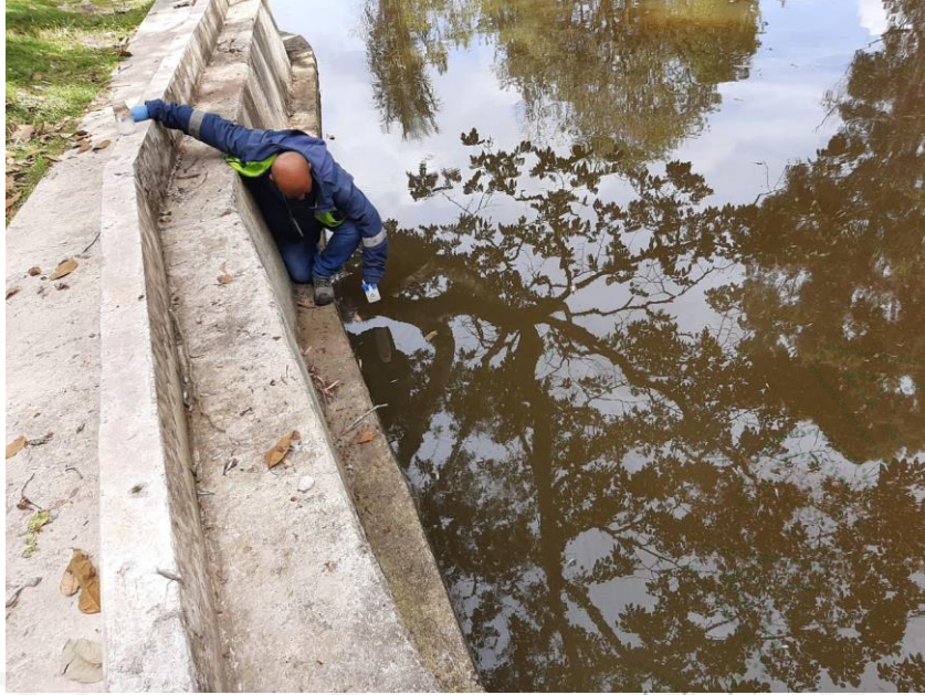
Toma de muestras en el cuerpo receptor