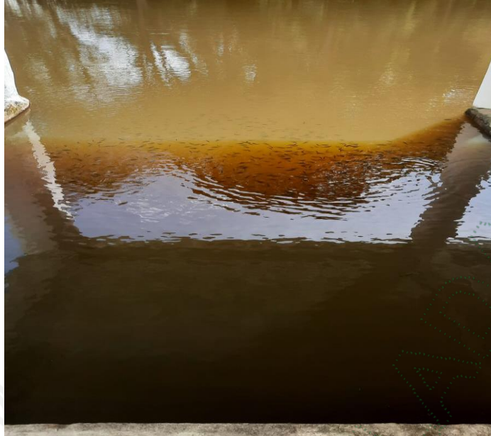
Cardumen de peces sobrenadando en el Lago

El día 26 de junio se hace otro recorrido y allí no se evidencia la presencia de peces muertos, es posible que hayan sido extraídos por la misma corriente del Lago, sin embargo, aunque no hay presencia de mortalidad de peces se observa una nata oleaginososa en uno de los sectores del Lago.