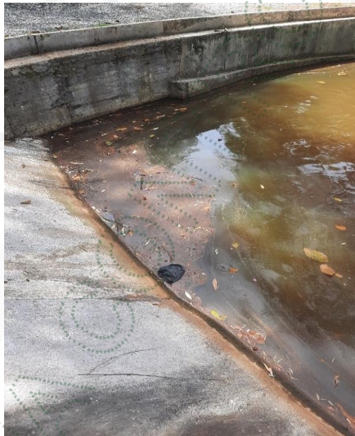
Natas oleaginosas en el cuerpo receptor

En los últimos 15 días se han presentado condiciones climáticas que no son propias de la zona, sin precipitaciones y con temperaturas que superan el promedio del municipio de Sonsón. El lago no presenta disminución del nivel y la fuente que lo abastece no presenta condiciones organolépticas que presuman alteraciones en ella.