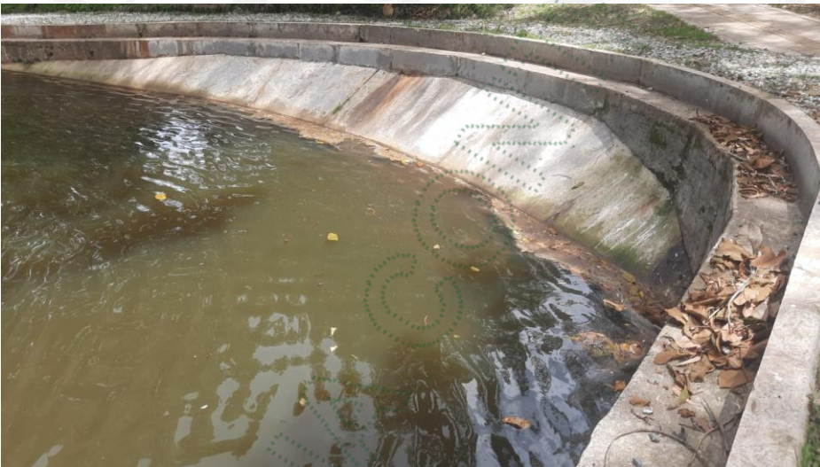
Nata observada el día 26 de junio sin presencia de mortalidad de peces

El día 26 de junio se hace otro recorrido y allí no se evidencia la presencia de peces muertos, es posible que hayan sido extraídos por la misma corriente del Lago, sin embargo, aunque no hay presencia de mortalidad de peces se observa una nata oleaginososa en uno de los sectores del Lago.