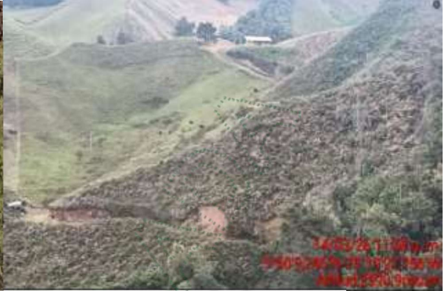
Izquierda Punto 3: marzo 2026.

Punto afectado No. 4 (manchón 4): FMI – 002-7597: Este fue el punto de mayor afectación en 2024. Se observó que el área presenta un proceso de recuperación vegetal natural, con predominio de helechales y otras coberturas herbáceas y arbustivas bajas, que han recolonizado gran parte de la superficie intervenida. De igual forma, se evidenció la persistencia de zonas con suelo quemado. Dentro del proceso de regeneración también se identificó el establecimiento de algunas especies nuevas, entre ellas guayabos y moras silvestres, las cuales se encuentran colonizando de manera dispersa el área afectada. Adicionalmente, según la información suministrada durante la visita, el lote fue sembrado en Pino patula sin autorización del propietario.