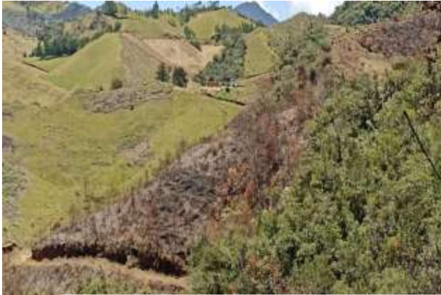
Derecha Punto 3. 2024. Fuente: IT-05975-2024.

Punto afectado No. 3 (manchón 3): FMI – 002-11823: La quema fue suspendida. Se observa una recuperación parcial de la cobertura vegetal, con colonización predominante de vegetación baja y helechales sobre la mayor parte del área anteriormente afectada. Esta condición permite evidenciar una mejoría frente al estado inicial, al reducirse considerablemente la superficie con cobertura totalmente seca o desnuda.