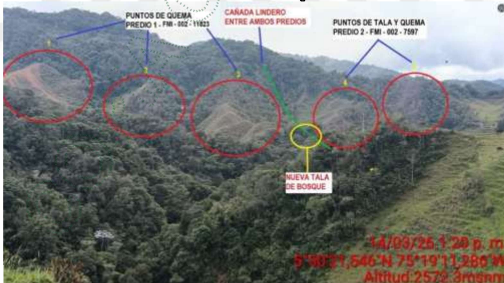
Vista de la afectación desde la carretera veredal marzo 2026

Para mayor ilustración de la situación encontrada, se describe a continuación cada uno de los puntos afectados