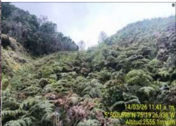
Derecha Punto 4. 2024.