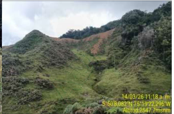
Derecha Punto 1. 2024. Fuente: IT-05975-2024. 2026.