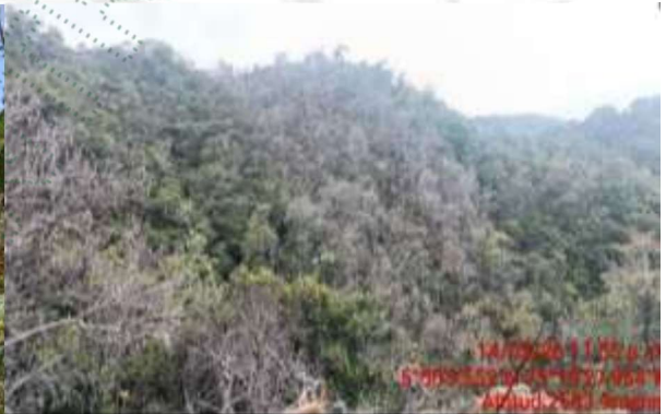
Derecha Punto 5. 2024.