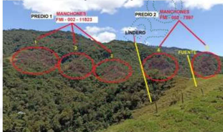
Vista de la afectación desde la carretera veredal agosto 2024. Fuente: IT-05975-2024.

Las actividades de quema fueron suspendidas en ambos predios. Actualmente, los puntos afectados por la quema, identificados en el IT-05975-2024 como manchones, presentan una cobertura vegetal baja, conformada principalmente por helechos. En general, se evidencia un proceso de recuperación natural incipiente, con predominio de vegetación baja en las áreas intervenidas. Durante el recorrido se observaron algunos individuos de especies como guayabos de monte y moras silvestres, lo que da cuenta del establecimiento gradual de nueva cobertura vegetal. No obstante, el suelo aún presenta residuos superficiales de la quema. De acuerdo con el nivel de afectación observado, se estima que las áreas impactadas requerirán varios años para recuperar su cobertura vegetal natural y restablecer la biodiversidad existente antes de la intervención. Así mismo, durante el recorrido no se evidenció presencia de fauna silvestre, lo que sugiere que el área aún no ofrece condiciones ecológicas adecuadas para su retorno. Las siguientes imágenes muestran la vista desde la carretera: