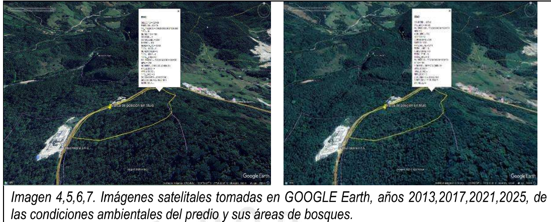
Imagen 4,5,6,7. Imágenes satelitales tomadas en GOOGLE Earth, años 2013,2017,2021,2025, de las condiciones ambientales del predio y sus áreas de bosques.

Verificación de Requerimientos o Compromisos: Resolución 134-0040-2012 del 10 de abril del 2012, por medio del cual sea autoriza un permiso de erradicación de árboles aislados.