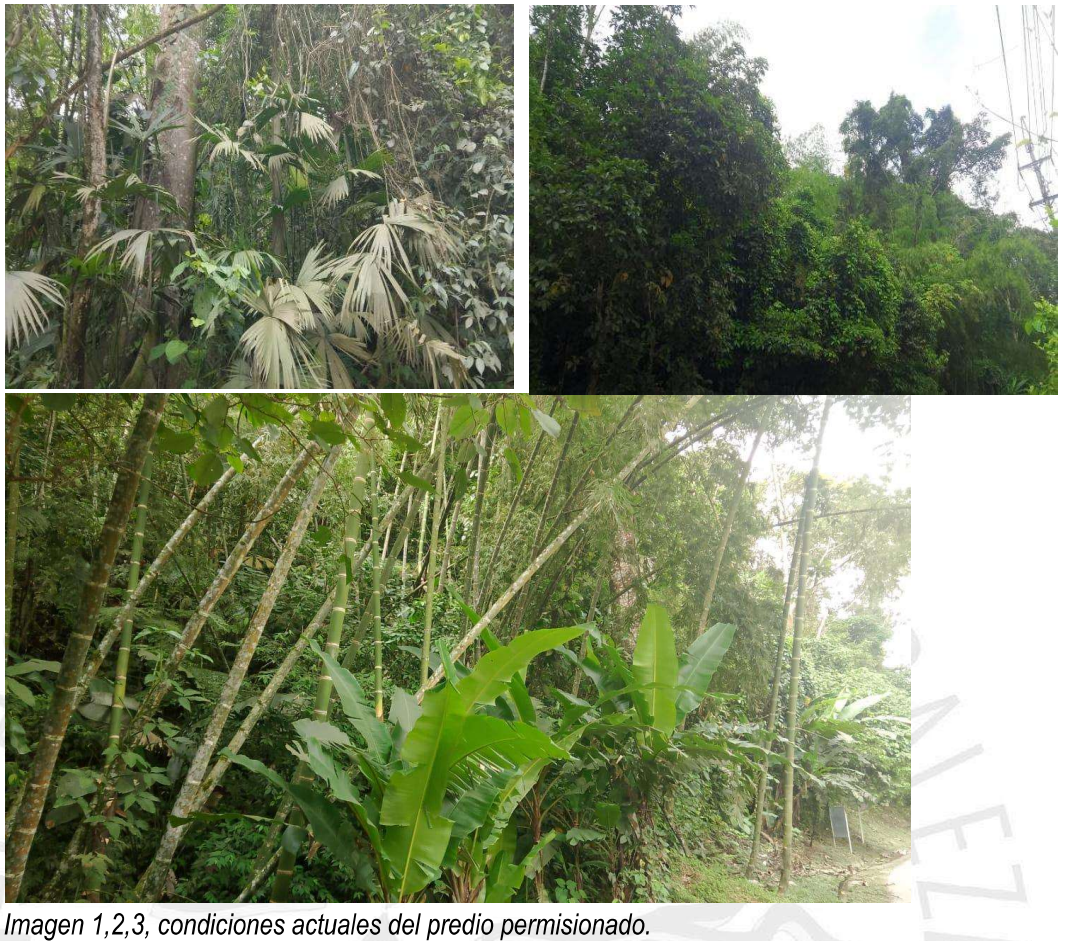
Imagen 1,2,3, condiciones actuales del predio permisionado.