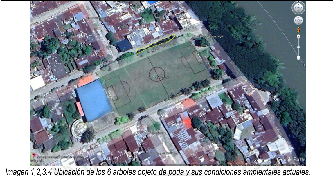
Imagen 1,2,3,4 Ubicación de los 6 arboles objeto de poda y sus condiciones ambientales actuales.