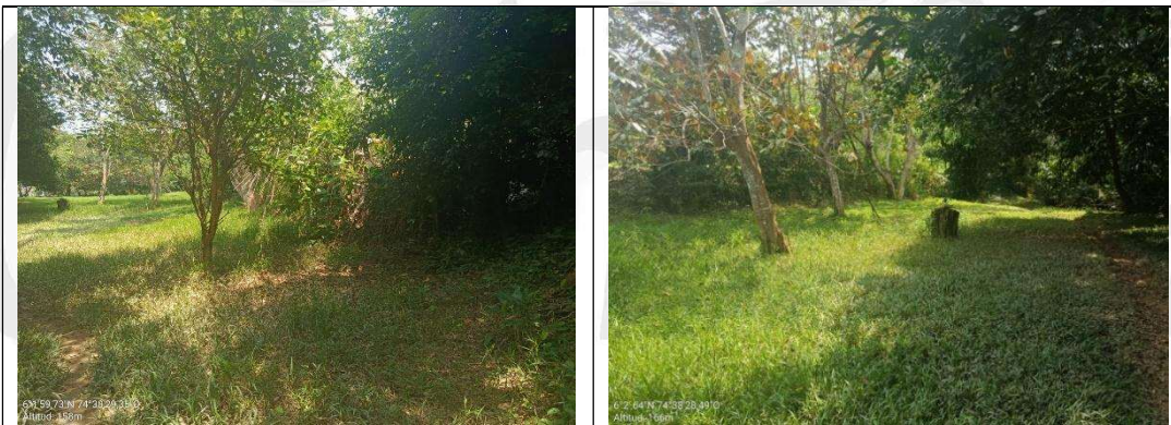
Imágenes 1 y 2. Condiciones actuales del predio. Cornare 2026.