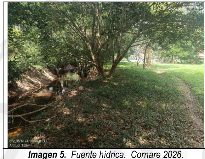
Imagen 5. Fuente hídrica. Cornare 2026.