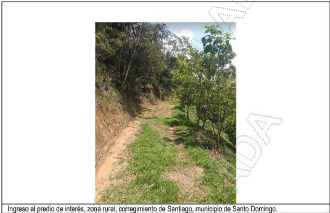
Ingreso al predio de interés, zona rural, corregimiento de Santiago, municipio de Santo Domingo.