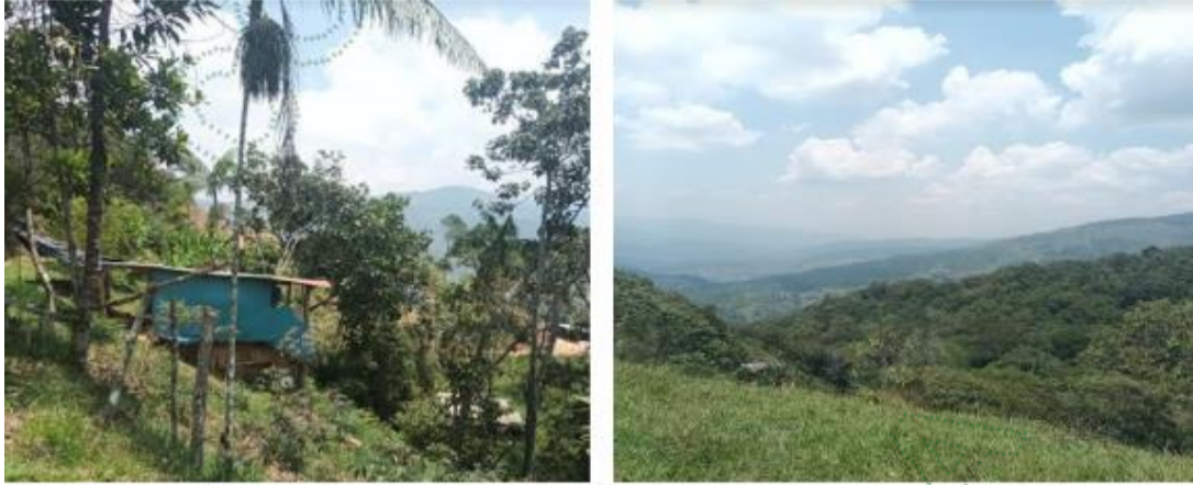
Interior del predio de interés, zona rural, corregimiento de Santiago, municipio de Santo Domingo