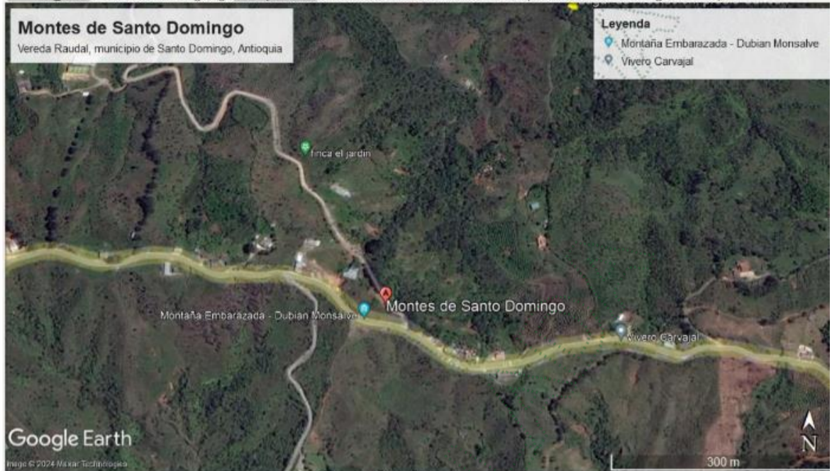
Figura 1. Visualización geográfica predio de interés, vereda Raudal, municipio de Santo Domingo, Antioquia.

3.3. Una vez en el predio de interés se realiza inspección ocular al interior del predio en compañía de la señora Adriana Montés, una de las trabajadoras del lugar identificada con cédula de ciudadanía 48.823.508 y quien responde al número 311 337 4256, ella informa que en el lugar no se ha presentado alguna tala salvo la quema de restos de la construcción de una cabaña ubicado en el lote #5 y que fue una quema de corto tiempo.