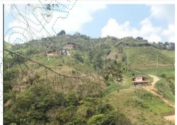
Fotografía 3 y 4. Interior del predio, vista general, Montes de Santo Domingo, vereda Raudal, municipio de Santo Domingo.