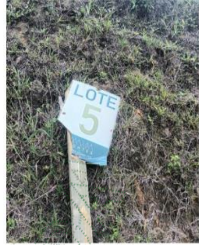
Fotografía 1 y 2. Lote #5 al interior del predio Montes de Santo Domingo, vereda Raudal, municipio de Santo Domingo.