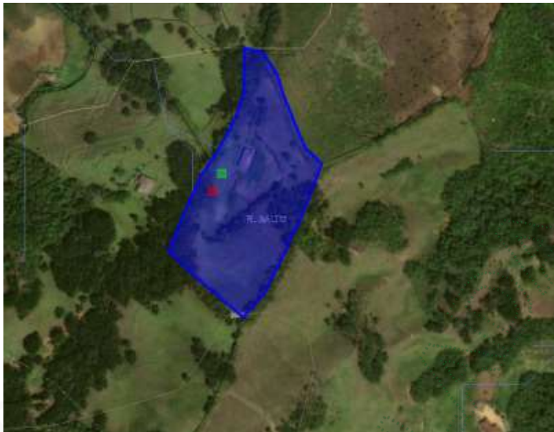
Imagen 1: Ubicación del predio.

Una vez en el sitio se pudo observar que actualmente en el predio no se evidencian afectaciones ambientales de ninguna índole. En la zona intervenida según Queja Ambiental SCQ-133-0808-2017 del 04 de agosto de 2017, se encuentra establecida una zona de potrero en la cual se respeta el distanciamiento a la fuente hídrica de forma adecuada.