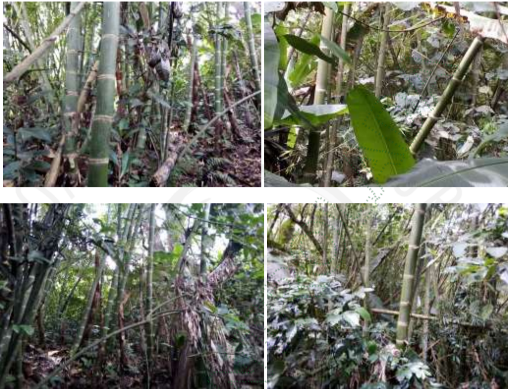
Condiciones actuales del sitio.

4. Que de conformidad con lo establecido en la Resolución 1740 de 2016, se solicitó a la Unidad de Control y Seguimiento mediante oficio con radicado CI – 01703 del 29 de septiembre de 2022, ampliación al Informe Técnico IT – 05746 del 07 de septiembre de 2022, en el sentido de indicar si la intervención realizada consistió en un manejo silvicultural del guadua; por lo que mediante un nuevo Informe Técnico IT – 01255 del 28 de febrero de 2023, se observó y concluyó entre otras lo siguiente: