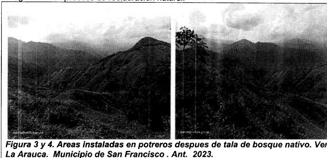
Figura 3 y 4. Areas instaladas en potreros despues de tala de bosque nativo. Ver La Arauca. Municipio de San Francisco . Ant. 2023.

Verificación determinación adoptada en el artículo segundo de la Resolución 134-0250-2017 del 20 de Octubre de 2017 en la que se ordena abrir indagación preliminar.