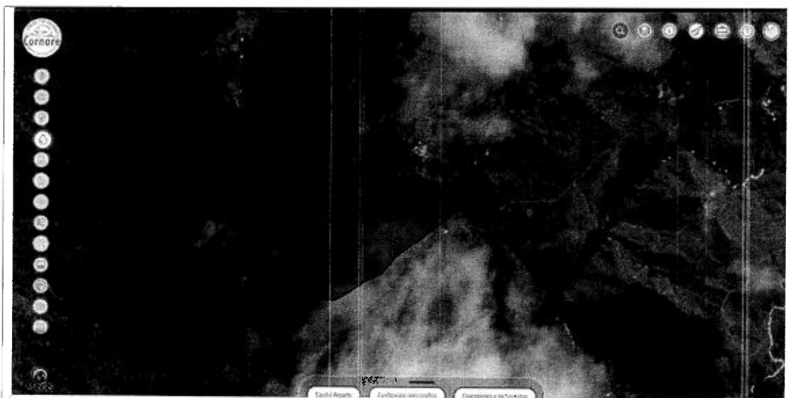
Figura 1. Area total del predio afectado por tala bosque nativo. Vereda La Arauca. Municipio de San Francisco . Ant. Imágenes Geoportal Cornare 2023.