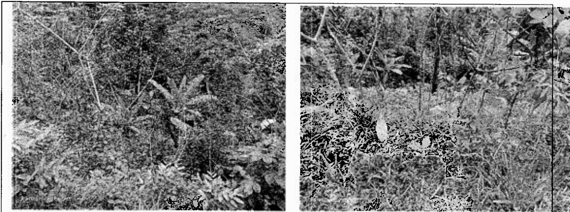
Figura 3 y 4. Areas instaladas en cultivo de yuca y platano despues de tala de bosque na Vereda El Pescado. Municipio de San Luis. Ant. 2023.

Verificación de recomendaciones: verificar el cumplimiento de las recomendaciones contenidas en el informe técnico IT-01760-2022 del 17 de marzo de 2022 y el comunicado con radicado CS-02700-2022 de 22 de marzo de 2022, por parte del señor Edgar de Jesús Galeano Galeano identificado con cedula de ciudadanía número 70.350.559.