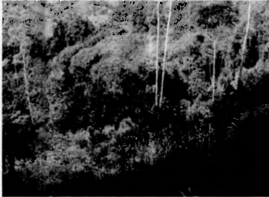
Imagen 1- Area afectada en regeneración natural.