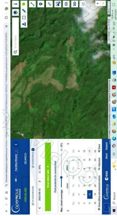
Figura 3. Estado del área posterior todas las afectaciones (Se evidencia deforestación);