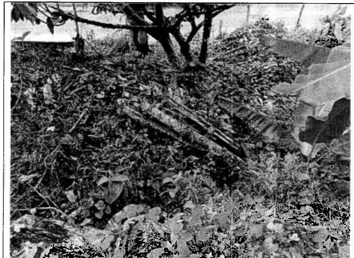
Figura 4. Vestigios de tala de arboles sobre a quebrada El Mirador.