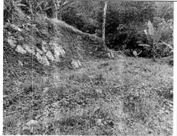
Figura 3. Movimiento de tierra en franja de protección de la quebrada El Mirador. Vereda La Maravilla Municipio de San Francisco