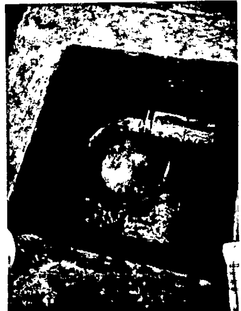
Imagen 1 y 2. Estado actual de la obra de captación y control de caudal implementada.

Como se observa, en la imagen 1 se evidencia la instalación de una tubería en el primer compartimiento de la obra de captación, la cual, será utilizada para la limpieza del mismo y reemplazando la función que tenía la anterior tubería que conectaba ambos compartimientos anteriormente. En la imagen 2, se observa que la derivación del recurso hídrico se realiza exclusivamente por la tubería con reducción ubicada en la parte superior de la obra.