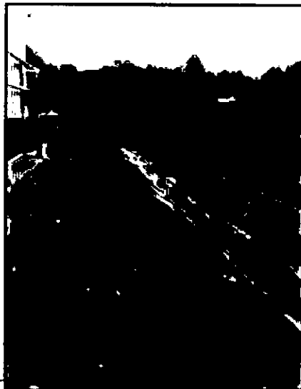
Ilustración 2. Canal donde se realiza vertimiento.