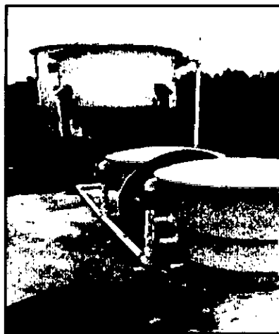
Ilustración 1. Sistema de tratamiento Actual.

Se realiza visita a la empresa PREPARACIONES DE BELLEZA "PREBEL S.A", donde se realizó recorrido por el sistema de tratamiento de aguas residuales domésticas, en donde se evidenció que la empresa ha realizado modificaciones al sistema aprobado mediante Resolución 131-0712-2015 del 27 de octubre de 2015, ya que se adicionó una unidad de sedimentación y un reactor aerobio, por lo cual deberá solicitar la respectiva modificación del permiso de vertimiento.