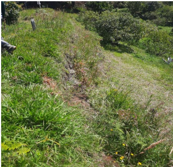
Antigua acequia en otro sector