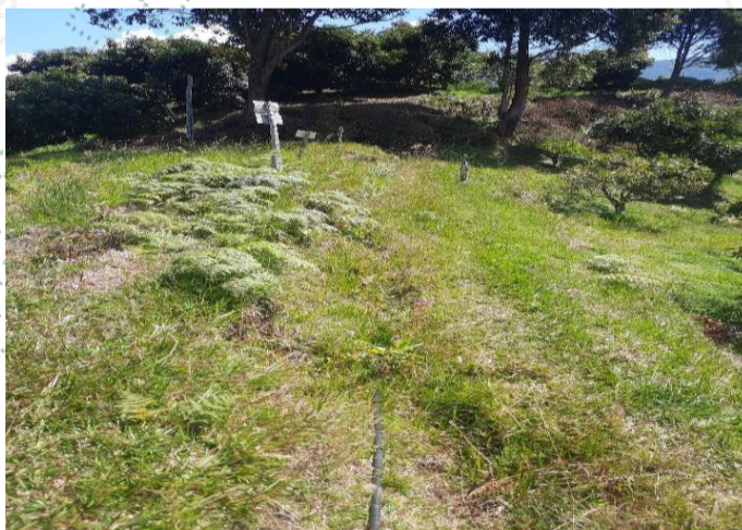
Manguera instalada sobre la antigua acequia