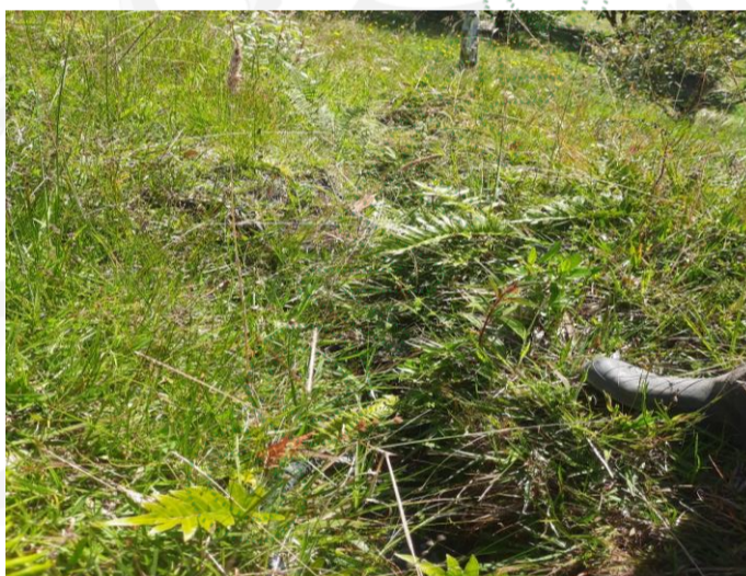
Antigua acequia sin presencia de agua