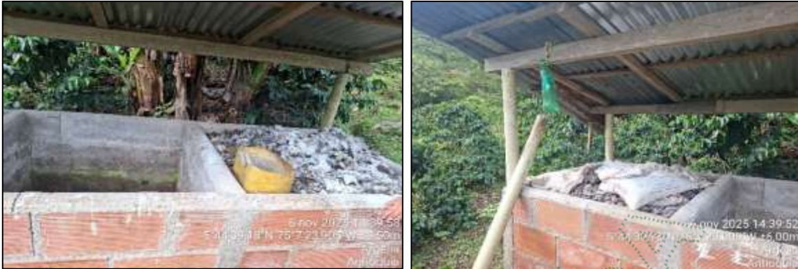
Compostera ubicada en el predio de interés.

El agua residual generado por el lavado de los corrales, siguen siendo vertidos a la fuente hídrica denominada Tabanales, ubicado a unos 60 metros aproximadamente del predio de interés.