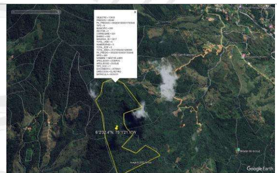
Imagen satelital año 2020 de las condiciones ambientales del predio