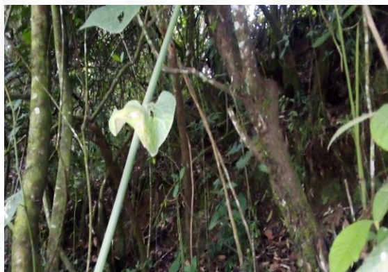
Condiciones actuales de la zona.