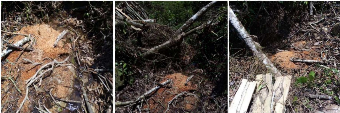
Aprovechamiento dentro de otra fuente de agua.