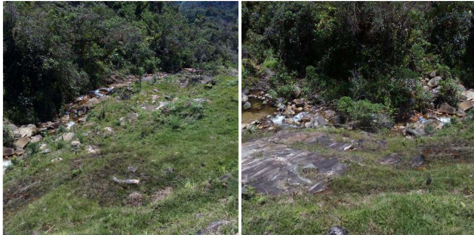
Fotos del sitio de la intervención inicial, a la orilla de la fuente de agua, transformada en potrero.