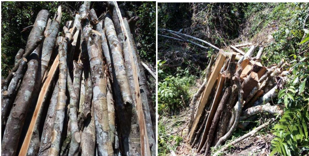
Madera producto del aprovechamiento.

Que en cumplimiento del Auto AU-02034-2024 del 21 de junio de 2024, funcionarios de la Corporación realizaron visita técnica el día 29 de octubre de 2024, generándose el Informe Técnico IT-07355-2024 del 29 de octubre de 2024, dentro del cual se observó y concluyó entre otras lo siguiente: