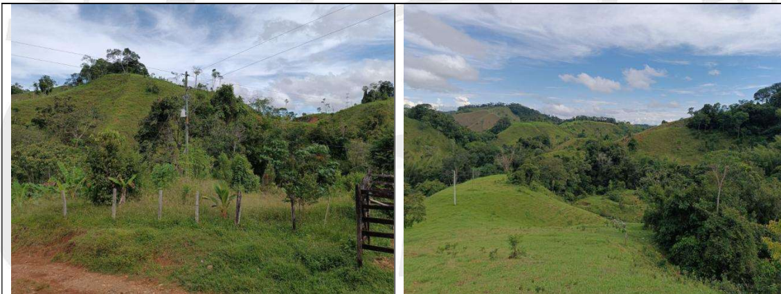
Imágenes 8 y 9 Estado actual del predio