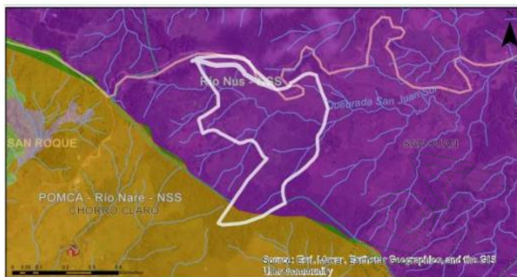
Imagen 2. Zonificación ambiental – Geo portal

En groso modo analizando las determinantes ambientales de esta área de interés, se determina que: