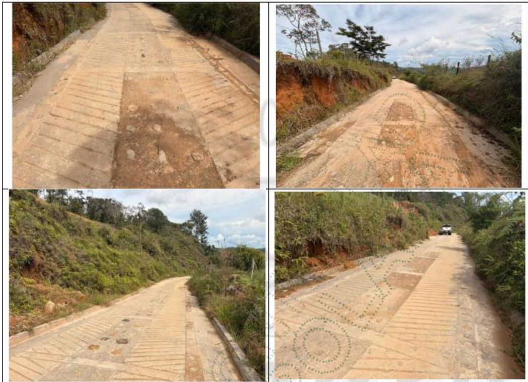
Imagen 1 – Placa huella finalizada - 2025

No se evidencian afectaciones ambientales en los laterales de la placa huella. La infraestructura fue construida sin intervenir fuentes hídricas, ya que se encuentra ubicada a una distancia adecuada de estas. Asimismo, no se observan impactos sobre la flora del área intervenida.