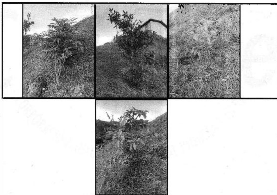
Imagen 4. Cornare. 2022. Especies vegetales plantadas en el primer punto de aprovechamiento.