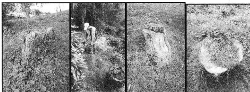
Imagen 1. Cornare. 2022. Tocones resultantes del aprovechamiento forestal.