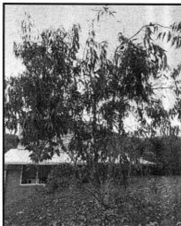
Imagen 3. Cornare. 2022. Árbol de Eucalipto plantado en la primera siembra para la compensación.