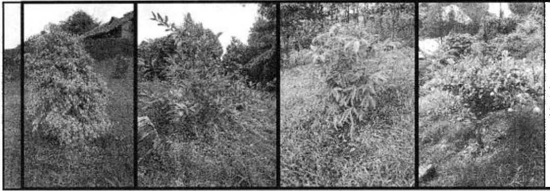
Imagen 5. Cornare. 2022. Especies vegetales plantadas en el segundo punto de aprovechamiento (parte posterior de la vivienda).