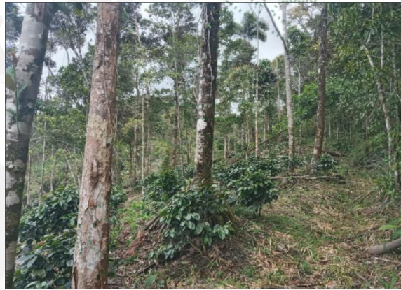
Estado actual del área donde se presentó el aprovechamiento forestal