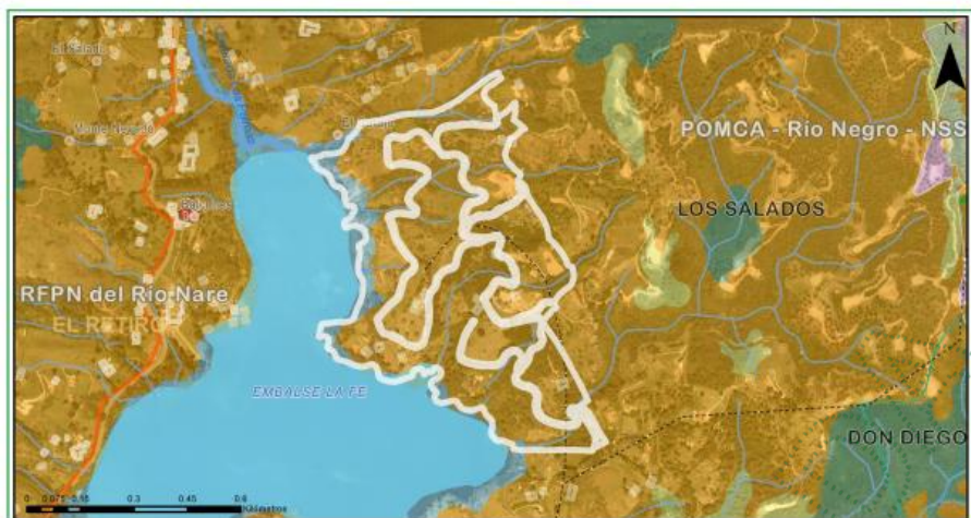
Imagen 2: Zonificación ambiental del predio según el POMCA.

Zona de Uso Sostenible: es la zona donde se desarrollan todas las actividades de producción, extracción, construcción, adecuación o mantenimiento de infraestructura, relacionadas con el aprovechamiento sostenible de la biodiversidad, así como las actividades agrícolas, ganaderas, mineras, forestales, industriales y los proyectos de desarrollo y habitacionales no nucleadas con restricciones en la densidad de ocupación y construcción siempre y cuando no alteren los atributos de la biodiversidad previstos para cada categoría.