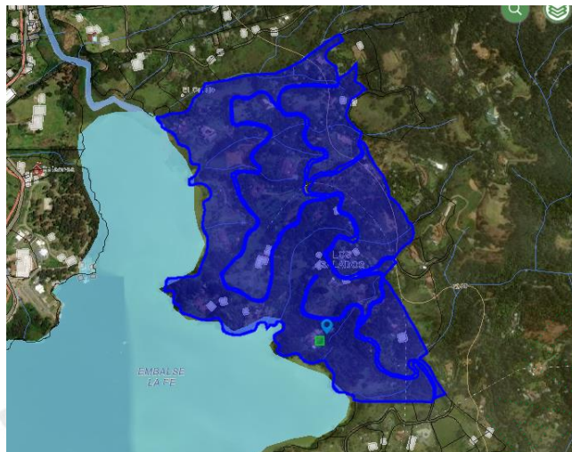
Imagen 1: Ubicación del predio de interés