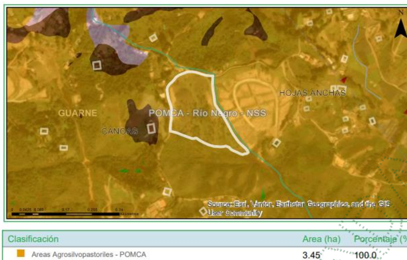
Imagen 2. Determinantes predio de interés

Áreas agrosilvopastoriles: Categoría de Uso Múltiple - Áreas Agrícolas - POMCA: El desarrollo se dará con base en la capacidad de usos del suelo y se aplicará el régimen de usos del respectivo Plan de Ordenamiento Territorial (POT); así como los lineamientos establecidos en los Acuerdos y Determinantes Ambientales de Cornare que apliquen. La densidad para vivienda campesina será la establecida en el POT y para la vivienda campestre según el Acuerdo 392 de Cornare.