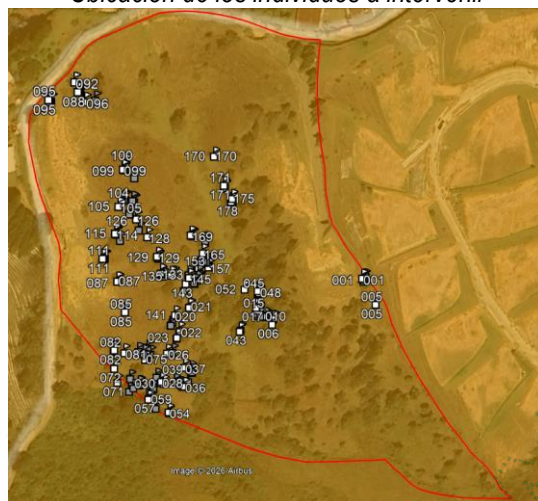
Ubicación de los individuos a intervenir