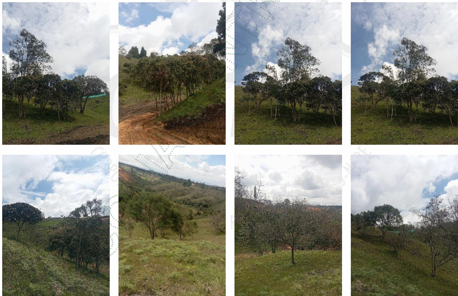
Imágenes. Árboles a intervenir