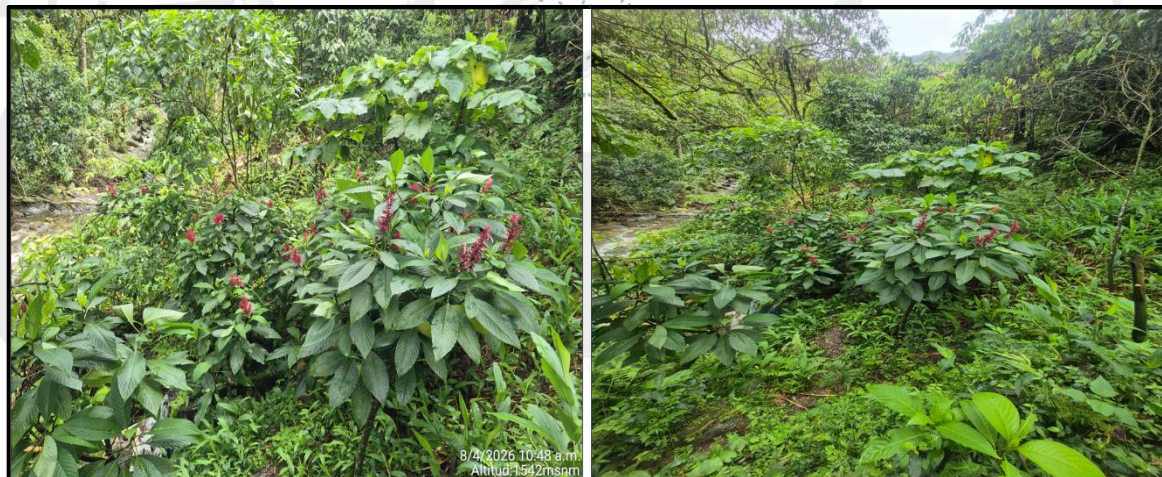
Imagen 2: Especie tipo ornamental Megaskepasma erythrochlamys .