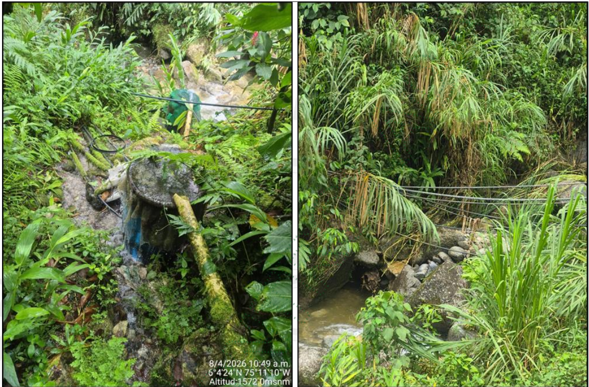
Imagen 3: Sistema no regulado de captación de agua fuente hídrica 1.