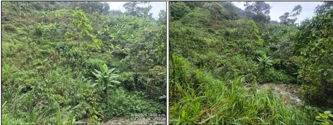
Imagen 1: Área previamente intervenida con proceso de regeneración natural, con presencia de vegetación en estado de brinjal y latizal, lo cual indica una recuperación incipiente del ecosistema, también hay presencia de cultivos de plátano y yuca.