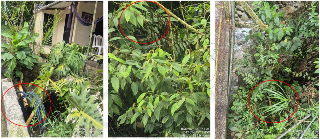
Imagen 6: Tuberías de aguas residuales sobre el cauce de la Q. La Chonta