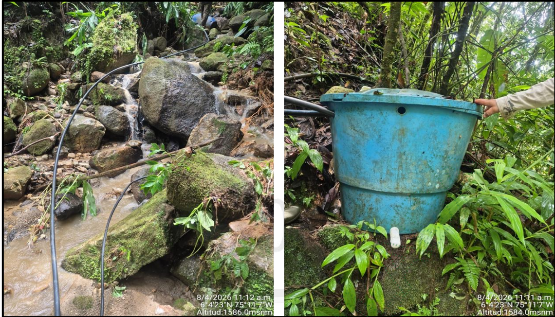
Imagen 4: Sistema no regulado de captación de agua en la fuente hídrica 2.