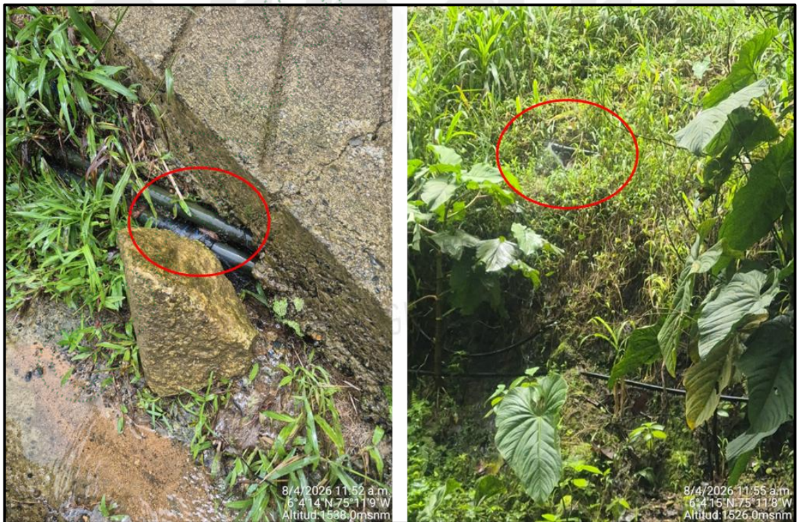
Imagen 5: Mangueras con fugas de agua.