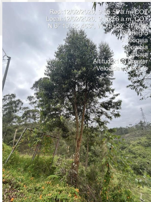
Imágenes 3 y 4. Árboles a intervenir