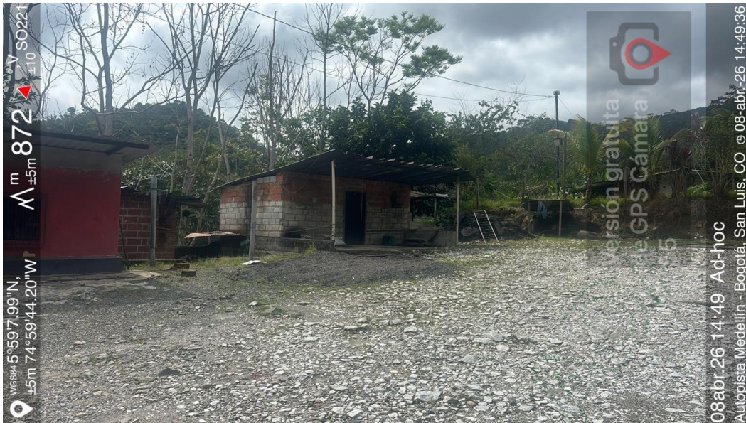
Imagen 1: Caseta que era destinada para el albergue de los trabajadores.

Durante la visita, se constató que el predio cuenta con un área aproximada de 1,67 hectáreas, localizado sobre la margen de la autopista Medellín–Bogotá, en las coordenadas geográficas 5°59'8" N y 74°59'44" W. En el sitio se identifican dos (2) construcciones: una destinada a vivienda y otra utilizada como establecimiento tipo tienda. Se evidenció que la infraestructura asociada al lavadero de vehículos no se encuentra en operación, en concordancia con lo manifestado por la señora Salazar.