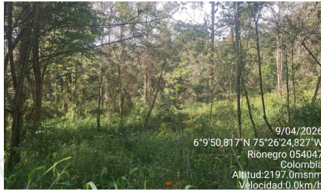
Imagen 1. Predio de interés

Cabe resaltar que del predio matriz con FMI 020-30174, fueron derivadas las matrículas con FMI 020-248643 (De interés en el presente informe técnico) y FMI 020-248642, también de propiedad de los interesados, el cual ya tiene permiso de concesión de aguas superficiales (Expediente 056150245661).