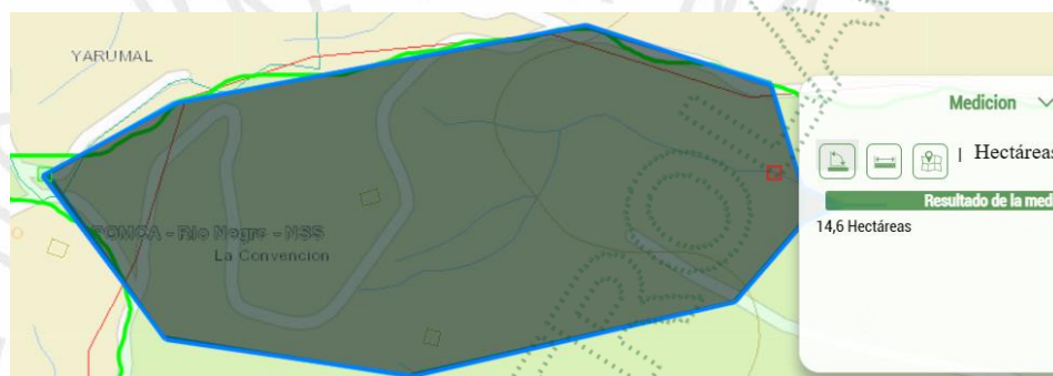
Imagen 5. Área de captación Fuente La Rocío.

3.6 El área de captación de la fuente se calculó utilizando el Geoportal interno de la Corporación en las coordenadas longitud -75^{\circ} 25' 29.71'' , Latitud 6^{\circ} 9' 49.29'' WGS84 2221 msnm para la fuente hídrica La Rocío, Distancia aguas abajo 100 metros, y radio de reubicación 60 m, donde se implementó el método Cenicafe, dando un área de 14.6Ha