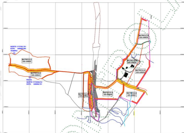
Imagen 3. Cartografía predio de interés.

Por otro lado, se identificó que el predio matriz se encuentra en zonas donde se establece el Acuerdo Corporativo 251 del 2011 por medio del cual se fijan determinantes ambientales para la reglamentación de rondas hídricas y nacimientos de agua en el oriente del departamento de Antioquia jurisdicción Cornare y establece los retiros estipulados por el POT (Acuerdo 002 de 2018) municipal respectivamente.