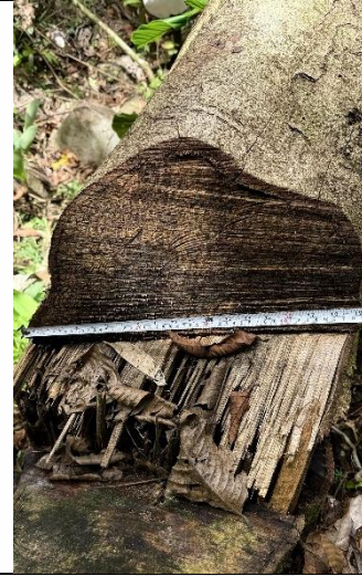
Imagen 2. Tocón encontrado