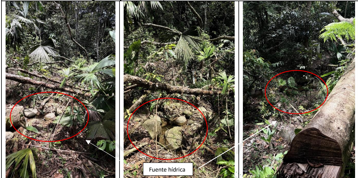
Imagen 6. 7 y 8. Árboles aprovechados cerca a la fuente hídrica