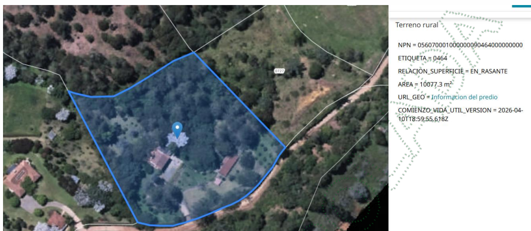
Imagen 1. Actualización área catastral predio 017-39152

del área catastral del predio de interés, sin embargo, no se aporta la ficha catastral oficial. Con el objetivo de obtener una respuesta más eficiente se envía un correo electrónico a la Dirección de Sistemas de Información Territorial – DSIT del municipio de El Retiro donde el usuario recibió respuesta de la actualización catastral, solicitando confirmación sobre el ajuste del área del predio, obteniendo como respuesta que efectivamente el área aportada es la oficial. Se consulta con la oficina jurídica de la regional, dando viabilidad a la evaluación del trámite con esta nueva área catastral.