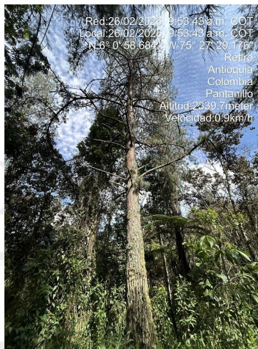
Imagen 4 y 5. Árboles a intervenir