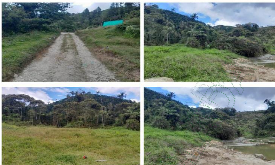
Imágenes del estado actual del predio, y las fajas de retiro de la quebrada antes intervenida