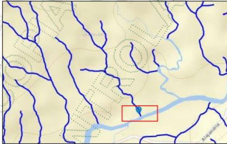
Imagen 2. Río Concepción - Drenaje Doble Principal.

Con base en la inspección realizada en campo, se presenció una actividad económica agropecuaria – (porcícola) , Esta actividad cuanta con 22 cerdos distribuyéndose de la siguiente manera : 2 Marranas de Crías , 11 lechones – bebes y 7 Cebos jóvenes – Ver imagen 3 en las coordenadas -75^{\circ} 12' 21.17'' W 6^{\circ} 23' 04.56'' N , que según la Resolución 02011-2022 del 31/05/2022 “POR MEDIO DE LA CUAL SE ADOPTAN EL PROCOCOLO PARA EL REGISTRO DE USUARIOS DEL RECURSO HÍDRICO- RURH” en el Ítem 6 lineamientos corporativos Subtema tabla 6.1.1 – Tabla para definir subsistencia y actividad productiva, la actividad presente en el predio del señor Uriel Cifuentes No se cataloga para “Subsistencia” Sino para actividad productiva.