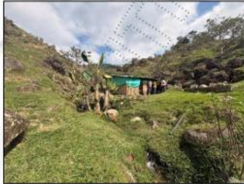
Imagen 2. Infraestructura de actividad Porcicola sobre la faja de protección del afluente.