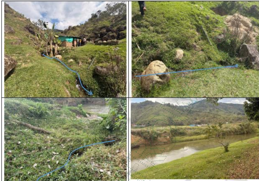
Imagen 7, Flujo del afluente hasta conectarse con el Río Concepción.

Por otro lado, se evidencia lo siguiente: