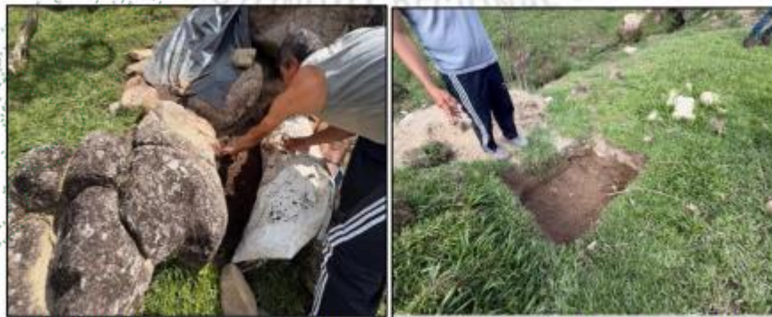
Imagen 4 y 5. Acopio de Compostera y excavación para tanque estercolero.

Se determina que el establo destinado a la actividad porcícola no cuenta con un sistema adecuado para el manejo de las aguas residuales no domésticas (STARnDs), ya que no dispone de tuberías ni de cama baja con material absorbente que permita su correcta gestión; estas aguas, provenientes de orina, heces y del lavado del establo (con agua y en algunos casos jabones u otras sustancias), se manejan sin tratamiento previo, lo que puede generar afectaciones al afluente cercano. Asimismo, no se evidencia infraestructura adecuada para el manejo de residuos, como un sistema de compostaje técnicamente implementado ni un tanque estercolero para el tratamiento de la porcínaza líquida (ver Imagen 4), sumado a que el establo se encuentra a menos de 7 metros de la faja de protección del afluente, lo cual no es adecuado; adicionalmente, se manifiesta la intención de construir un tanque estercolero enterrado a menos de 5 metros de dicha faja de protección (ver imagen 5), alternativa que no es viable ambientalmente debido al riesgo de contaminación directa del recurso hídrico.