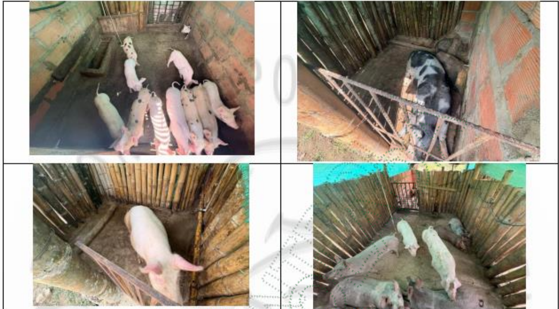
Imagen 3. Actividad Porcícola del señor Uriel Franco.

Se determina que el establo destinado a la actividad porcícola no cuenta con un sistema adecuado para el manejo de las aguas residuales no domésticas (STARnDs), ya que no dispone de tuberías ni de cama baja con material absorbente que permita su correcta gestión; estas aguas, provenientes de orina, heces y del lavado del establo (con agua y en algunos casos jabones u otras sustancias), se manejan sin tratamiento previo, lo que puede generar afectaciones al afluente cercano. Asimismo, no se evidencia infraestructura adecuada para el manejo de residuos, como un sistema de compostaje técnicamente implementado ni un tanque estercolero para el tratamiento de la porcínaza líquida (ver Imagen 4), sumado a que el establo se encuentra a menos de 7 metros de la faja de protección del afluente, lo cual no es adecuado; adicionalmente, se manifiesta la intención de construir un tanque estercolero enterrado a menos de 5 metros de dicha faja de protección (ver imagen 5), alternativa que no es viable ambientalmente debido al riesgo de contaminación directa del recurso hídrico.