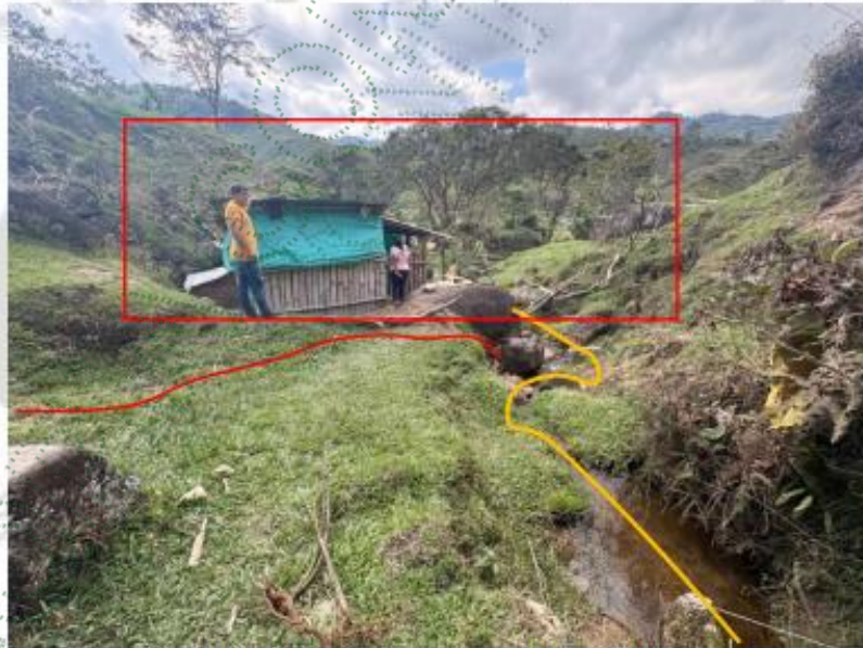
Imagen 6. Panorama del flujo del agua.

En la imagen 6, se evidencia el establo localizada a menos de 10 metros de la faja de protección del afluente, condición que, sumada a las escorrentías de las aguas residuales no domestica ( Heces, Orina , agua mezcladas con productos químicos) (indicada en la línea amarilla), pone de manifiesto una situación de alto riesgo de contaminación directa sobre el afluente, favoreciendo el transporte de cargas contaminantes hacia la fuente hídrica – Río Concepción, sin ningún tipo de manejo adecuado de la porcinaza líquida y sólida. comprometiendo la calidad del agua del drenaje doble principal -Río Concepción y el equilibrio ecológico alrededor, por otra parte, no se descarta la obligación de reubicar dicha infraestructura – (cuadro rojo)