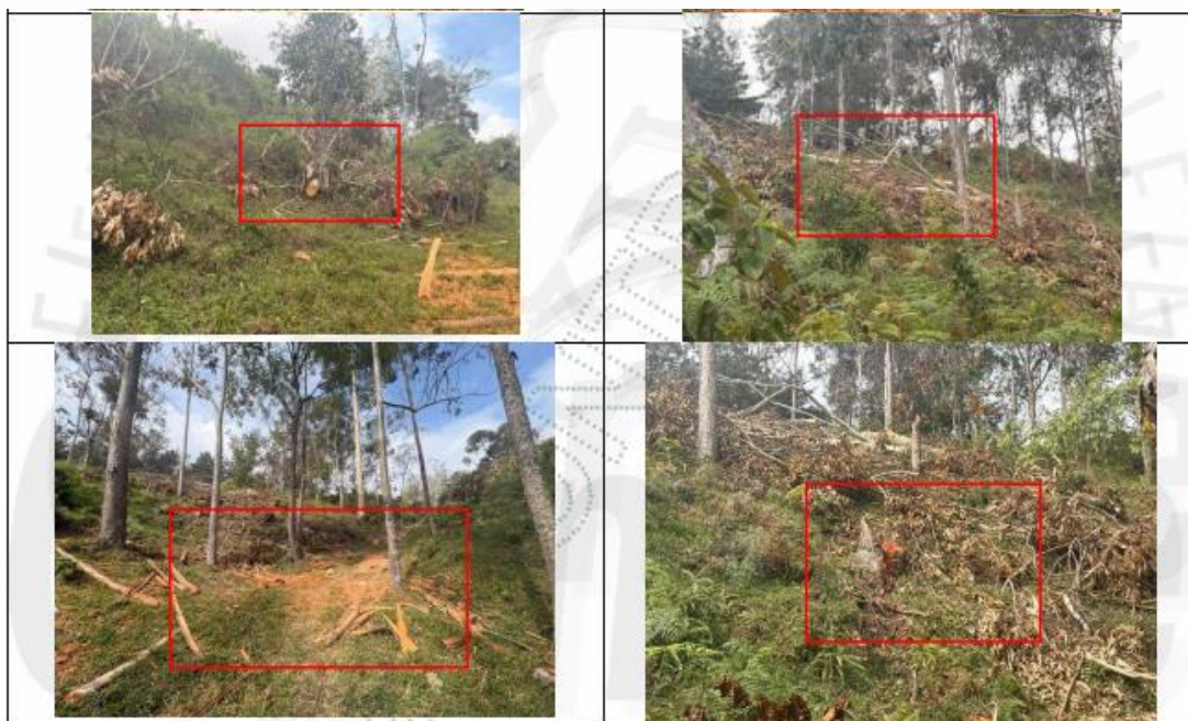
Imagen 1. Árboles talados – Permiso Vencido

Durante la inspección técnica realizada en el área objeto de evaluación, se evidenció la tala de cuatro (5) individuos arbóreos, la cual fue identificada mediante la observación de tocones recientes, residuos de madera, trozas y material vegetal disperso en el área intervenida.