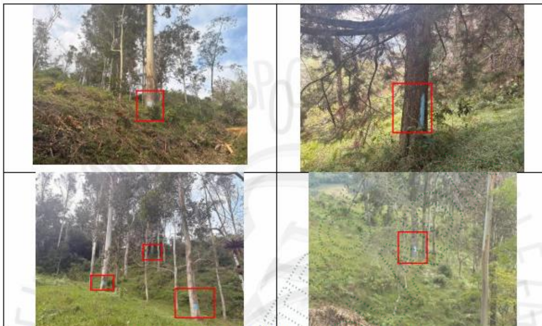
Imagen 2. árboles en pie marcados para talar- 10 Individuos

Durante la visita técnica de verificación se evidenció la presencia de diez (10) individuos arbóreos en pie, los cuales presentan marcación con pintura azul en el fuste, señal que comúnmente se utiliza para identificar árboles previamente seleccionados dentro de un aprovechamiento forestal autorizado.