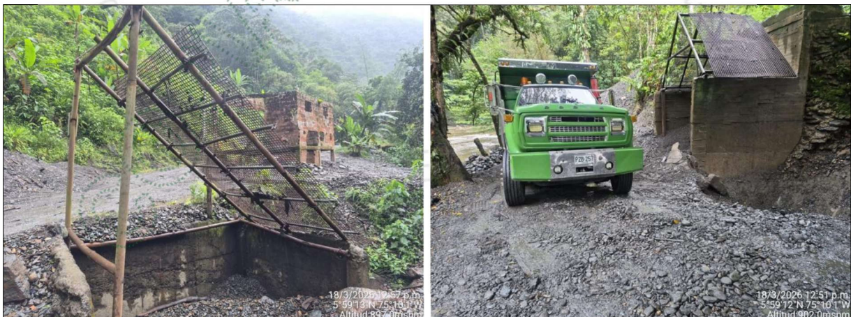
Imagen 5 y 6: Tamices simples inclinados para la clasificación granulométría del material.