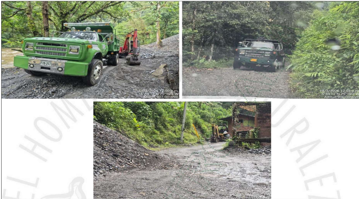
Imagen 2, 3 y 4: Volquetas sencillas en el predio de interés.