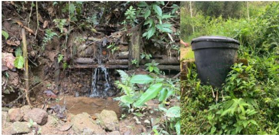
Figura 2. Fuente abastecedora y tanque de almacenamiento

La cuenca abastecedora se encuentra con buena cobertura vegetal, lo cual favorece la protección y conservación del recurso hídrico. Como sistema de captación se identificó una captación de toma directa, la cual abastece un tanque de almacenamiento de 1.000 litros; posteriormente, el agua es conducida a otro tanque plástico de 1.000 litros, desde donde se distribuye directamente hacia la vivienda para uso doméstico.