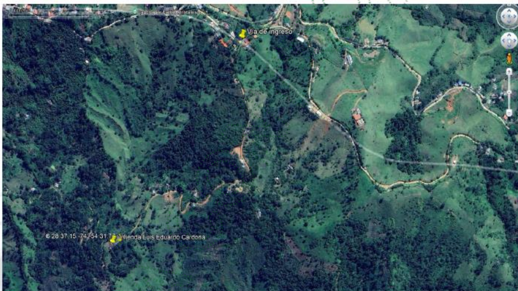
Figura 4. Ruta de acceso

Para llegar al sitio, Se toma la vía que desde la Zona Urbana del municipio de Alejandría conduce hacia el municipio de San Roque; llegar hasta el Corregimiento de Cristales, se continúa vía San Antonio pasando el sector Villa Nueva y continuando hasta el Plan donde encuentra una entrada a mano derecha, que conduce a un camino, el cual se recorre durante unos quince (15) minutos hasta llegar al punto localizado en las coordenadas -74^{\circ} 54' 31.77'' W; 6^{\circ} 28' 37.15'' N.