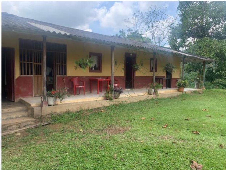
Figura 6. Vivienda rural dispersa

En este contexto, se realizó la actualización de la información del usuario y, en consecuencia, se procedió a efectuar la migración del registro, teniendo en cuenta que el uso del recurso se encuentra dentro de los criterios establecidos para actividades de subsistencia, conforme a lo definido en la tabla de criterios del Protocolo para el Registro de Usuarios del Recurso Hídrico (RURH).