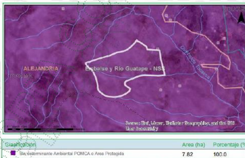
Figura 3. Determinantes Ambientales

b) El predio identificado con FMI: 0014387 PK-PREDIOS 6702002000000700028 con un área de 6.2Ha, del cual se desprende un área menor de 2 Ha. Donde se encuentra la vivienda de interés, no cuenta con restricciones ambientales, toda vez, que no está inmerso en El POMCA. No obstante, cuenta con las restricciones establecidas en el Acuerdo 251 de 2011, relacionadas con los retiros obligatorios a las fuentes hídricas.