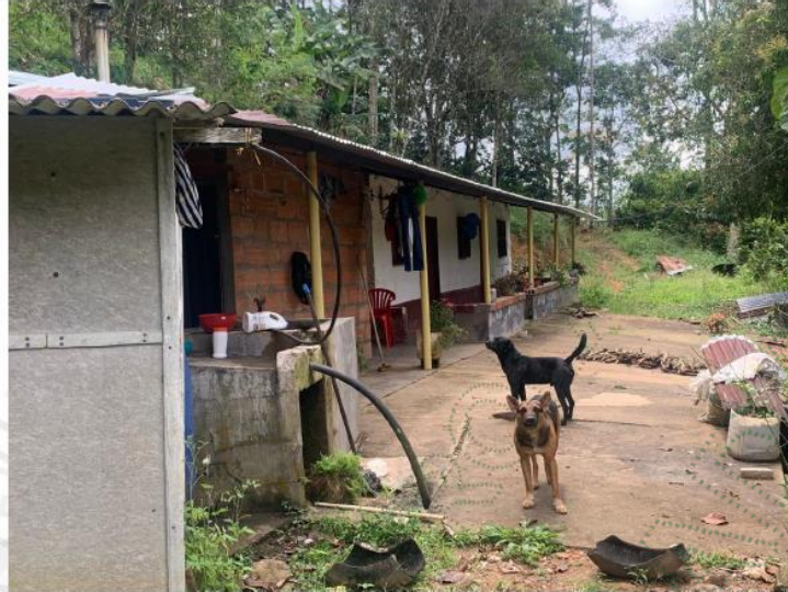
Figura 6. Vivienda rural dispersa

e) Las actividades generadas en el predio identificado con FMI: 0014387 PK-PREDIOS 6702002000000700028 del cual se desgaja un área menor de 2 Ha, cumple con los requisitos para ser registrado como se estipula en el Decreto 1210 del 2 de septiembre del 2020 y el Protocolo para el Registro de Usuarios del Recurso Hídrico – RURH de viviendas rurales dispersas adoptado por Cornare .